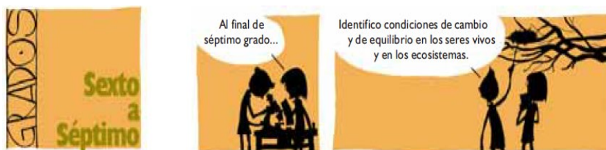
Figura 1. Estándares de aprendizaje de Ciencias Naturales para el grupo de grados de sexto a séptimo. MEN

Además, en Ciencias Naturales se tiene en cuenta unas competencias específicas relacionadas con los estándares, que les permiten a los estudiantes comprender fenómenos que son propios de dicha área del conocimiento e indagar acerca de ellos. Para la ejecución de la Secuencia didáctica relacionada con lo que los estudiantes deben Saber, Saber hacer y Saber Ser al finalizar, el grupo de grados Sexto-Séptimo, se deben tener en cuenta los siguientes estándares de competencias según el MEN (Ministerio de Educación Nacional, 1998):