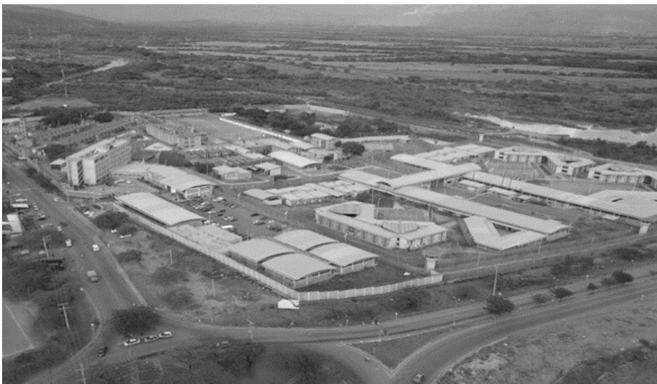
Figura 2 complejo Cúcuta, fuente: Instituto Nacional Penitenciario y Carcelario. INPEC.