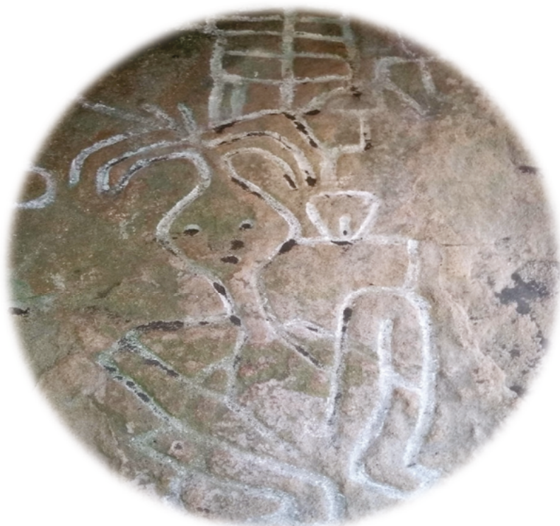
Ideograma de un mohán, autoridad espiritual Mokaná en el sitio sagrado de Kamaasjorhu