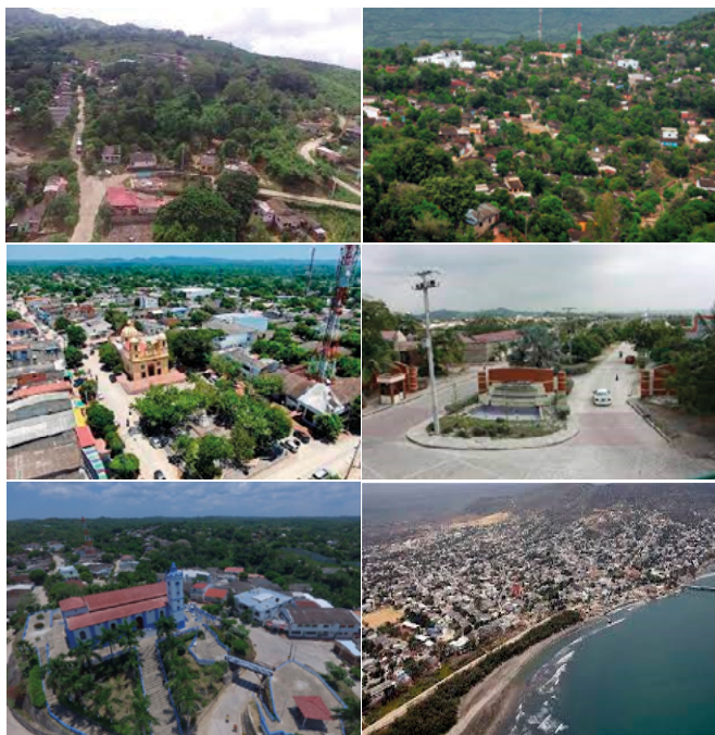
Fotos 24, 25, 26, 27, 28 y 29. Municipios de Piojó, Tubará, Baranoa, Galapa, Usiacuri y Puerto Colombia con presencia ancestral de comunidades indígenas Mokaná en el departamento del Atlántico.