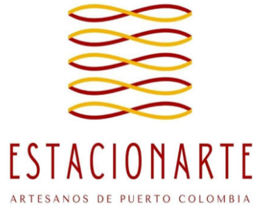
Imagen 5. Logo EstaciónArte

de talentosos artesanos locales, quienes han trabajado arduamente para dar vida a productos únicos, confeccionados a mano, utilizando materiales naturales de la más alta calidad. Surge como Colectivo desde la iniciativa de la Fundación Puerto Colombia, con la finalidad de potenciar el trabajo artesanal y hacerlo visible permanentemente. (Fundación Puerto Colombia, 2023).