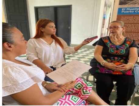
Fotografía 2. Entrevista a artesana