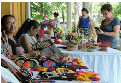
Imagen 6. Feria del Colectivo EstaciónArte

La Fundación Puerto Colombia, en alianza con la Red de Artesanos de Puerto Colombia, hizo realidad EstaciónArte. Es invaluable contar con el apoyo institucional de la Gobernación del Atlántico, lo cual garantiza el éxito y la larga duración de este acertado proyecto. En su conjunto, EstaciónArte representa una iniciativa sumamente positiva, enfatizando la importancia y el talento de nuestros artesanos locales, y brindando una experiencia cultural enriquecedora para todos los visitantes.