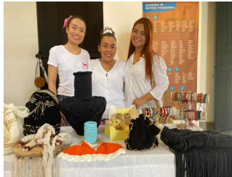
Fotografía 4. Equipo de trabajo.