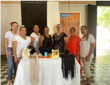
Fotografía 5. Muestras artesanales.