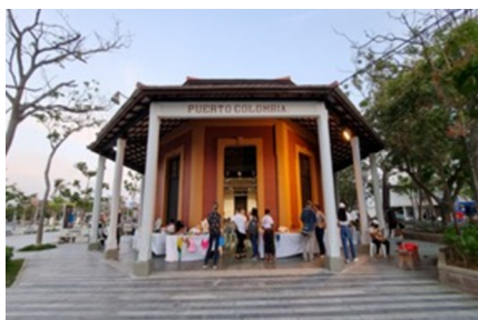
Imagen 4. Estación del Ferrocarril de Bolívar (Fundación Puerto Colombia, 2023)

Actualmente, cuenta con un amplio inventario y base de datos de los artistas, así como de las expresiones artísticas disponibles en el municipio: pintores, escultores, artesanos, escritores, bailarines de danza contemporánea, actores de teatro, cine y televisión, músicos, agrupaciones musicales y una orquesta sinfónica, al igual que un sinnúmero de miembros de la comunidad que cuentan con saberes y tradiciones culturales propias del contexto. (Fundación Puerto Colombia, 2023).