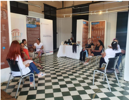
Fotografía 3. Entrevistas a artesanas.