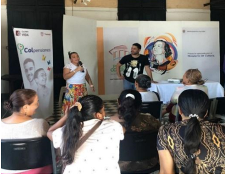
Fotografía 1. Socialización del proyecto.