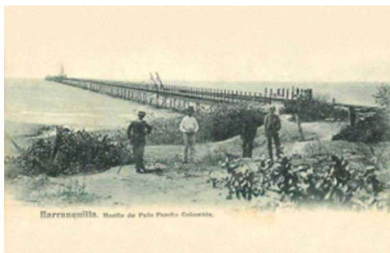
Imagen 1. Antiguo Muelle de Puerto Colombia

Puerto Colombia se configura como un Municipio colombiano situado en la región noroccidental del departamento del Atlántico. Puerto Colombia fue fundado el 31 de diciembre de 1888 por el Ingeniero cubano Francisco