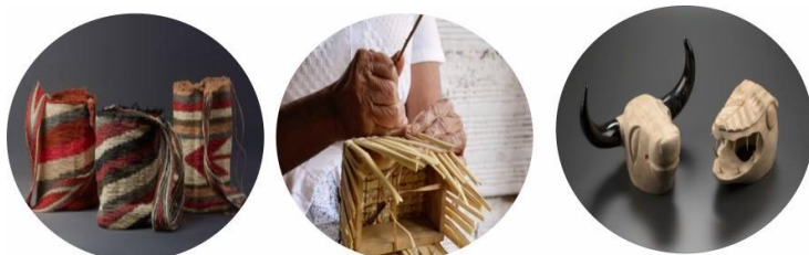
Figura 3. Clasificación de las artesanías.

En Colombia, las artesanías se encuentran clasificadas en tres tipos según los materiales y técnicas utilizadas, a saber: indígena, tradicional y contemporánea.