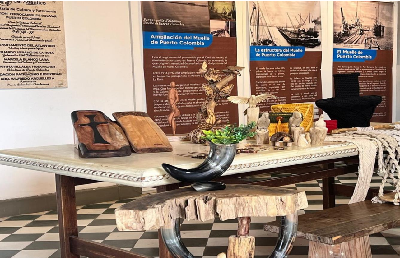
Fotografía tomada por Wendy Almendrales (2024).