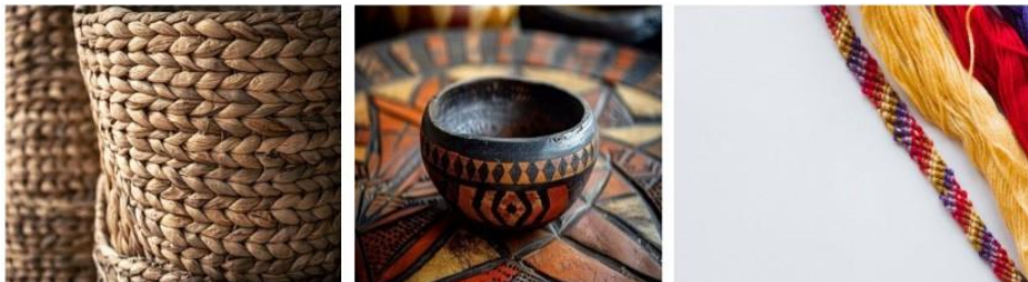
Figura 2. Artesanías en Latinoamérica.

de los artesanos y artesanas, y mejorar su acceso a los mercados. En particular, se han desarrollado iniciativas para integrar la innovación en el sector artesanal, promoviendo la adopción de nuevas tecnologías y técnicas de diseño. Estas acciones han permitido que este sector mejore la calidad y competitividad de sus productos, a la vez que conservan sus prácticas tradicionales. Además, la creación de redes y asociaciones artesanales, ha facilitado el intercambio de conocimientos y la colaboración a nivel regional.