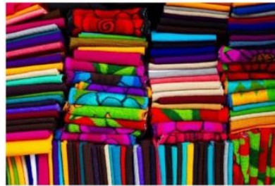
Cestería, cerámica, tejeduría (Colombia)

de los artesanos y artesanas, y mejorar su acceso a los mercados. En particular, se han desarrollado iniciativas para integrar la innovación en el sector artesanal, promoviendo la adopción de nuevas tecnologías y técnicas de diseño. Estas acciones han permitido que este sector mejore la calidad y competitividad de sus productos, a la vez que conservan sus prácticas tradicionales. Además, la creación de redes y asociaciones artesanales, ha facilitado el intercambio de conocimientos y la colaboración a nivel regional.