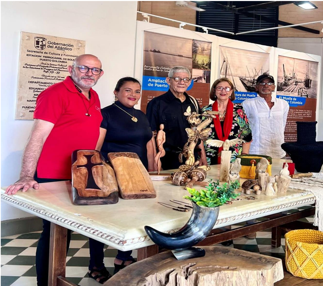
Fotografía tomada por Wendy Almendrales (2024).