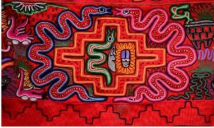
Textil de los Andes (Perú)