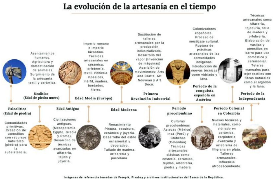
Figura 1. Evolución histórica de la artesanía.

En la época de la Independencia en Colombia, los artesanos desarrollaron una variedad de técnicas tradicionales que reflejaban la diversidad cultural y geográfica del país. Entre estas técnicas se encuentran la alfarería, la tejeduría, la talla de madera y la orfebrería (Acero, 1971; Artesanías de Colombia, 1990). Por ejemplo, en la alfarería, los alfareros colombianos utilizaban métodos ancestrales para modelar el barro y crear vasijas y utensilios tanto para uso doméstico como ceremonial. En la tejeduría, se empleaban telares manuales para tejer textiles con fibras naturales como el algodón y la lana, para crear diseños coloridos que representaban la riqueza cultural de las distintas regiones colombianas.