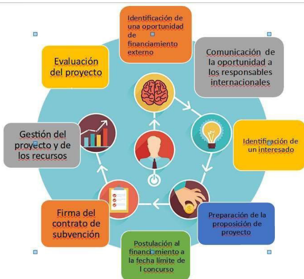
Figura 5. Ejemplo de flujograma

también revisar los tiempos internos frente al cronograma disponible para aplicar a la convocatoria.