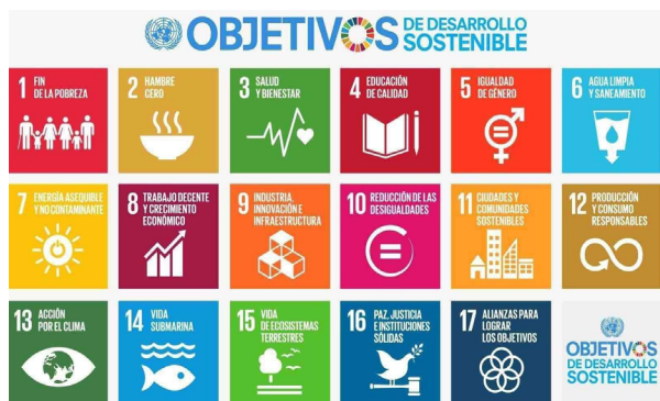
Figura 3. 17 Objetivos para transformar nuestro mundo