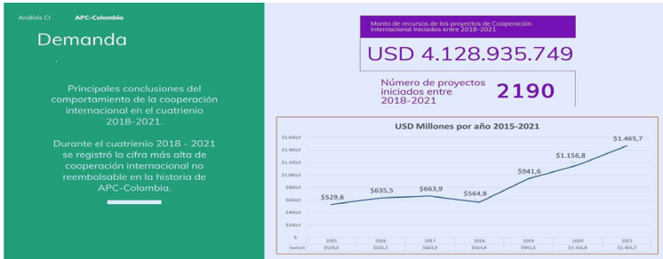
Figura 4. Monto de recursos de los proyectos de cooperación internacional iniciados entre 2018-2021

Nota. Se evidencia el auge de la cooperación internacional en Colombia entre el 2018 y el 2021.