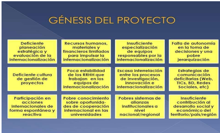
Figura 1. Génesis del proyecto Erasmus+ Riesal para fomentar una cultura de internacionalización en las instituciones de educación superior de la región

Nota. El gráfico representa las dificultades identificadas en la gestión de la internacionalización de las universidades latinoamericanas.