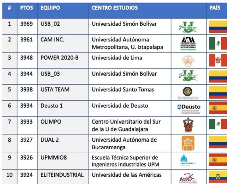
Figura 3 Ranking categoría Negocios Reto Company Game 2020

Durante los siete años en los cuales la Universidad Simón Bolívar ha estado presente en esta Competencia, un total de 63 estudiantes han participado en la competencia internacional, y 12 de ellos han logrado reconocimientos de la Empresa Organizadora y del Fondo Común Europeo, por ocupar el primer lugar en la categoría negocios. Al respecto, algunos de los logros más importantes se detallan a continuación.