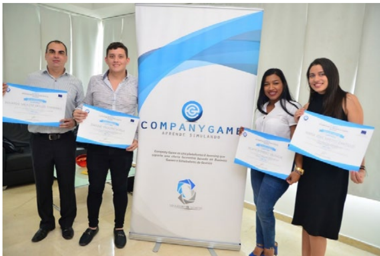
Figura 5 Reconocimiento de Company Game a los ganadores de la categoría negocios en el año 2018