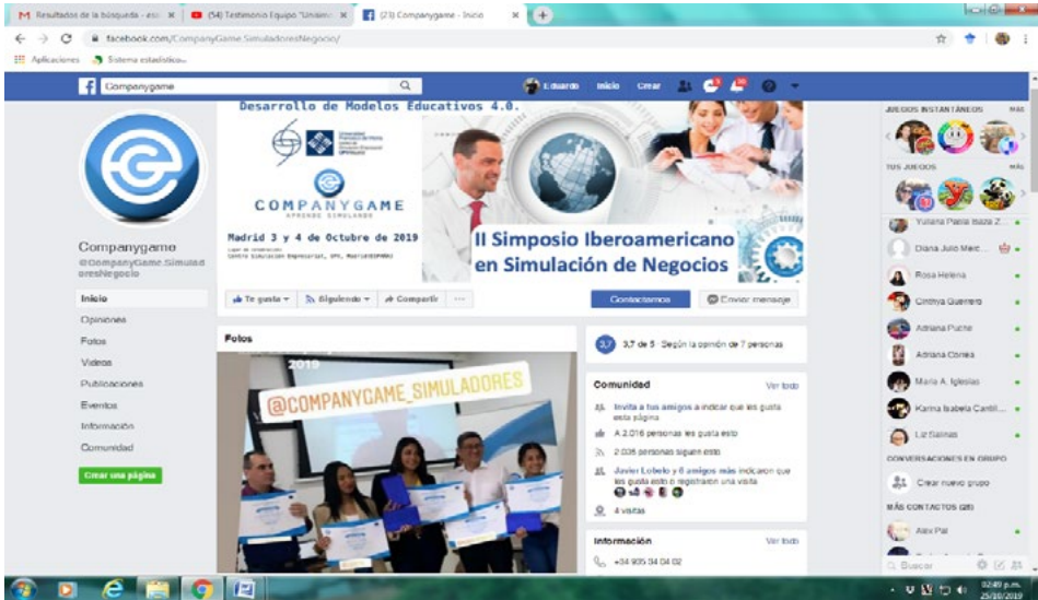
Figura 4 Publicación en redes sociales de los ganadores del Reto Company Game 2019