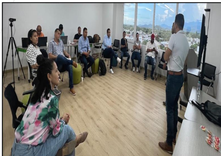
TABLA No. 4: Invitados VIP