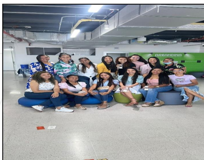
TABLA No. 3: Invitados VIP