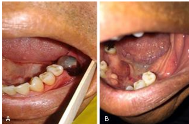
Fig. 2 – A: Paciente con HA leve, con coágulo inestable después de 10 días de la exodoncia del órgano dental 36, cuyo alveolo presentó un tiempo de sangrado espontáneo adecuado, y luego del control con cortes de puntos de sutura presentó la complicación, la cual fue controlada óptimamente. B: zona cicatrizada después de 40 días de realizada la exodoncia.

alveolar inferior y anestesia con infiltración lingual, podrían ser los únicos tratamientos que demandan hospitalización, debido a que corresponden a zonas anatómicas ricas en vascularización. (34) La cirugía periodontal, así como los procedimientos de exodoncias por método abierto en pacientes con hemofilia siempre debe considerarse como un procedimiento de alto riesgo con significativa pérdida de sangre, puede ser un desafío mayor a la hemostasia que una simple extracción, comúnmente la hemorragia posoperatoria suele ser un reto (Fig. 2, A y B). (4)