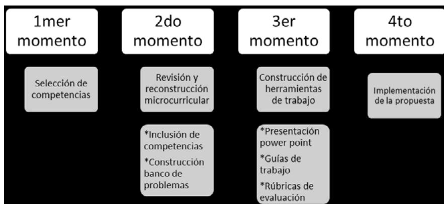
Figura 2 Momentos de la construcción de la propuesta

En el primer momento se establecieron las competencias ciudadanas a trabajar en las tres líneas temáticas; historia, cultura y tecnociencia. También se establecieron las competencias emocionales a fortalecer con la propuesta. Los profesores elaboraron un esquema con base en el módulo de competencias ciudadanas del ICFES. A continuación se presenta parte de las competencias que se propusieron por unidad de competencia.