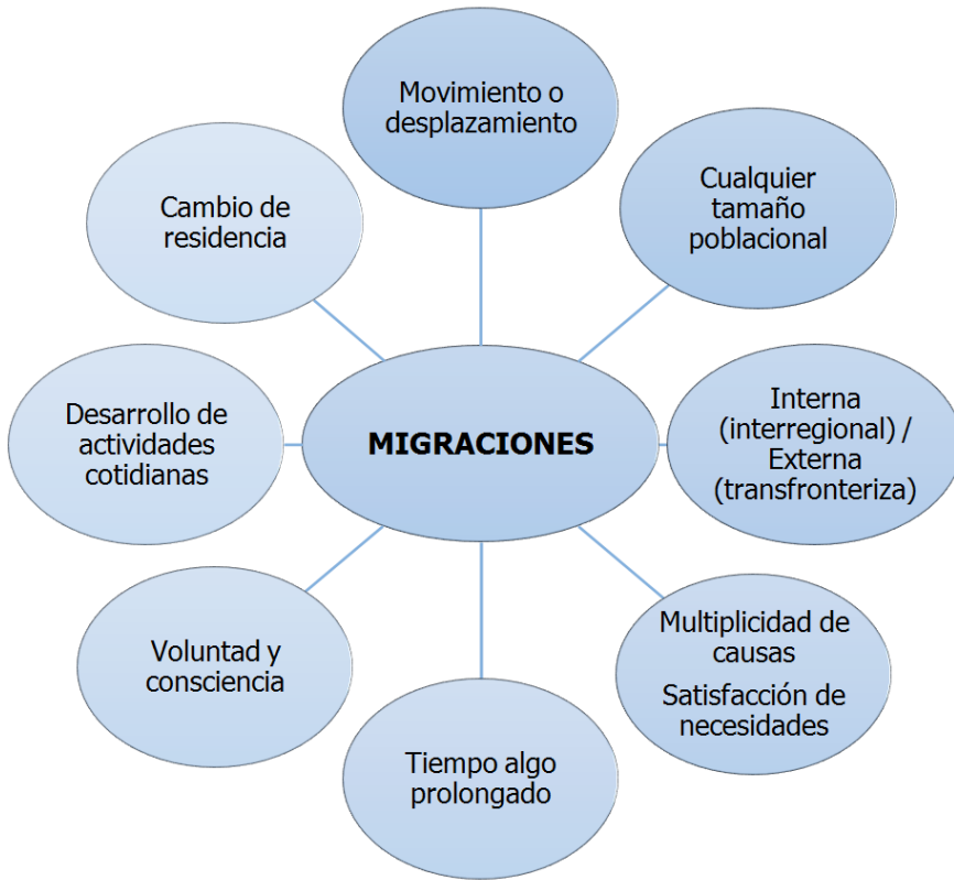
Figura 1. Elementos o características esenciales de las migraciones