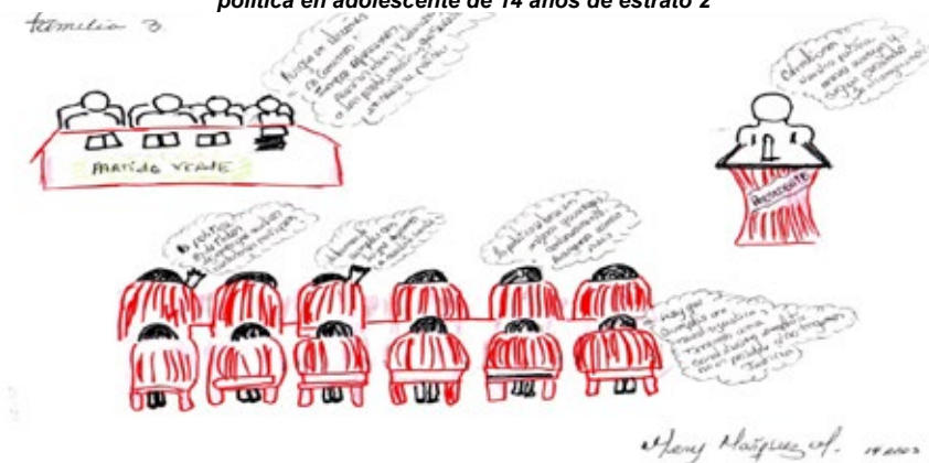
Ilustración 2 Representación social acerca de la participación política en adolescente de 14 años de estrato 2