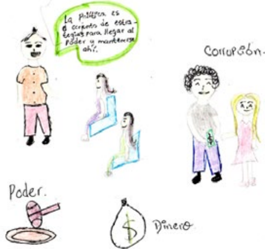
Ilustración 5 Representación social acerca de la participación política de niño de 13 años de estrato 3

Estudio 6. 13 años. Estrato 3. 11-13 años