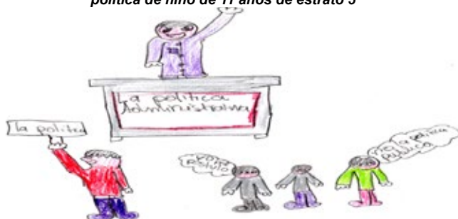
Ilustración 4 Presentación social acerca de la participación política de niño de 11 años de estrato 5

Fuente: Anexo 7. Técnica de dibujo aplicada a familia No. 9