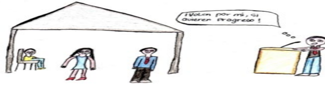
Ilustración 1 Representación social acerca de la participación política en adolescente de 15 años de estrato 4

Cuando me hablan de participación política, inmediatamente entiendo pienso en democracia, en un pueblo eligiendo a su gobernante; una de las palabras que también viene a mi mente es la corrupción, pues, si hablamos de la democracia la compra y venta de votos está presente. El concepto que yo tengo de participación política es que, democracia, cuando cualquier persona ya sea del común o no, puede ser parte en la política.