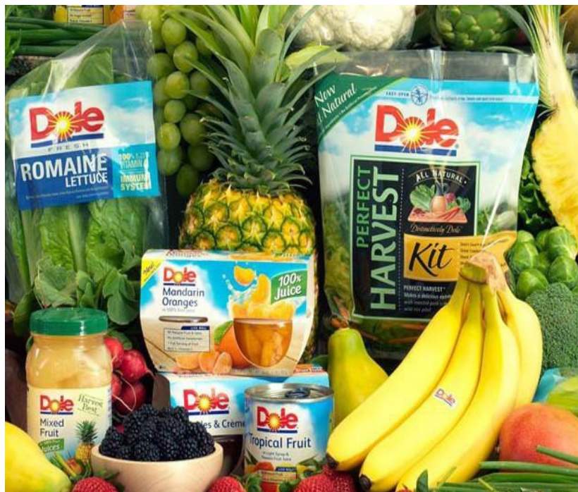
Figura 2. Portafolio Dole Food Company

El modelo de negocio de Dole Food Company Chile. Dole Food Company cuenta en Chile con nueve plantas de procesamiento de frutas y verduras distribuidas estratégicamente por todo el país; exporta 10 millones de cajas al año y es la sede regional para Latinoamérica de la multinacional norteamericana; adicionalmente, Dole Chile representó el 5 % de los ingresos de ventas en el 2010 en el segmento frutas frescas de la multinacional Dole.